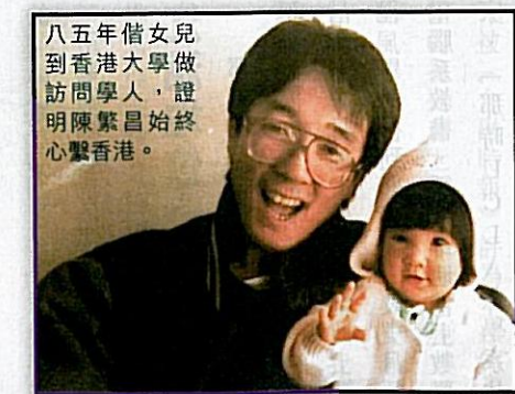
八五年偕女兒到香港大學做訪問學人，證明明陳繁昌始終心繫香港。