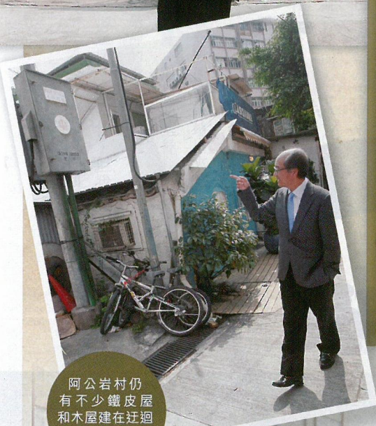
阿公岩村仍有不少鐵皮屋和木屋建在迂迴山道上。